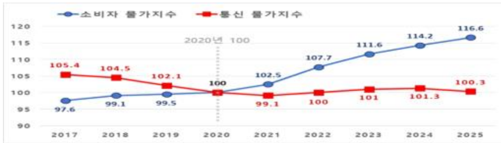
< 연도별 통신물가지수 현황(국가데이터처) >

* 통신물가지수 품목 : 우편서비스, 휴대전화기, 유선전화료, 휴대전화료, 인터넷이용료, 휴대전화기수리비