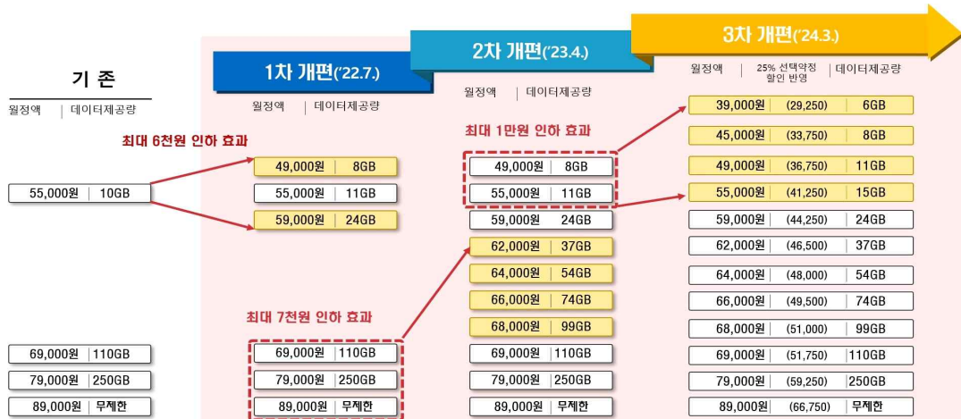
< SKT 5G 요금제 개편 현황 >